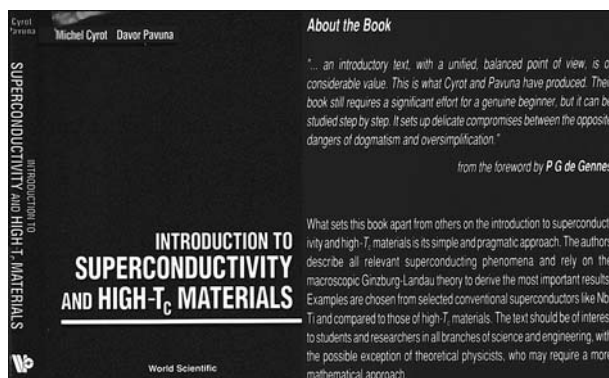
Slika 1. Naslovnica i poledina udžbenika Uvod u supravodljivost .

Koautor sam s prof. Michelom Cyrotom (Grenoble) izuzetno prihvaćenog udžbenika o supervodičima Introduction to superconductivity and high- T_c materials (1992). Udžbenik je imao privilegiju da je nobelovac, Pierre-Gilles de Gennes napisao vrlo pozitivan predgovor (slika 1), te je korišten u oko četiri tisuće sveučilišnih kolegija diljem svijeta. Bio sam gostujući profesor i savjetnik diljem svijeta. Bio sam vanjski suradnik Instituta za fiziku u Zagrebu, gostujući profesor u Osijeku, odnedavno i na PMF-u u Mostaru. Od 2015. predsjedam Tesla World Foundation (Smiljan). Bitna je redovna međunarodna konferencija From Solid State to Biophysics IX , koju organiziram s prof. Laszлом Forrom, EPFL. Svake dvije godine u Cavtat dovedemo ponajbolje stručnjake iz cijelog svijeta, a tu su uključeni i brojni stručnjaci iz Hrvatske. Cilj je podizati izvrsnost i široku disciplinarnost u našoj znanosti u 21. stoljeću. Zasad smo uspjeli u toj viziji!