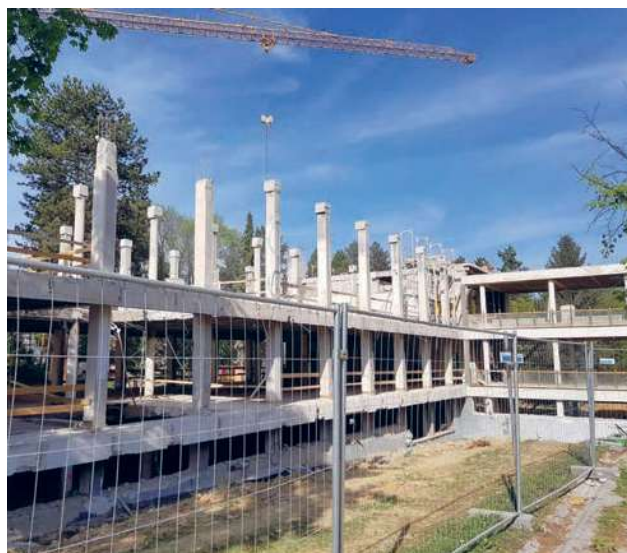
Slika 2. Građevinski radovi na Institutu za fiziku u okviru provedbe CALT projekta.

Građevinski radovi na I. krilu Instituta u okviru provedbe CALT projekta započeli su krajem siječnja 2020. godine, Slika 2. Planirano je trajanje radova 12 mjeseci. Na Slici 3. prikazan je izgled budućega CALT centra na Institutu za fiziku.