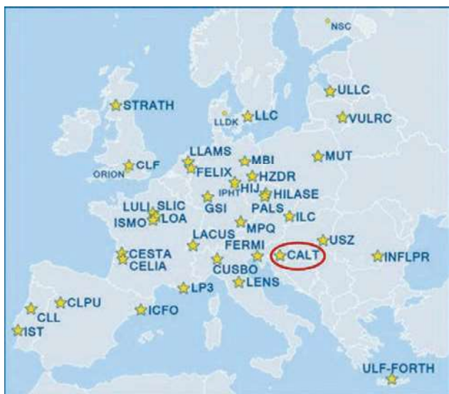
Slika 1. Karta s ucrtanim geografskim položajem partnera Laserlab Europe konzorcija.

Slijedom navedenoga, može se očekivati da će CALT centar preuzeti ulogu regionalnoga lidera u području napredne laserske infrastrukture te se u tome kontekstu Institut za fiziku pridružio Laserlab Europe konzorciju, https://www.laserlab-europe.eu , koji okuplja 35 vodećih institucija iz 18 europskih zemalja koje se bave interdisciplinarnim istraživanjima temeljenim na uporabi lasera, Slika 1. Cilj Laserlab Europe konzorcija umrežavanje je i pružanje podrške nacionalnim laserskim laboratorijima te razvoj novih primjena lasera koje su važne u istraživanju i inovacijama.