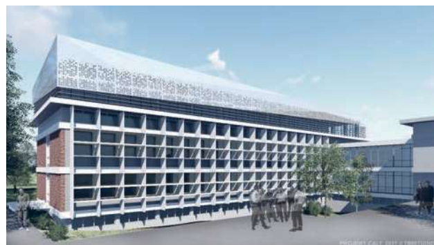
Slika 3. CALT centar na Institutu za fiziku.